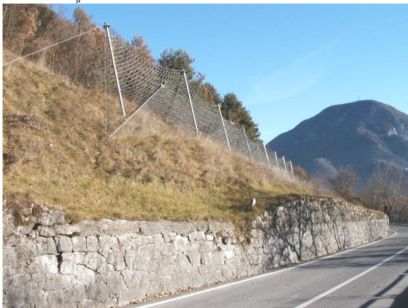
barriera paramassi tipo CAN in opera sulla S.P. del Sasso Tagliato