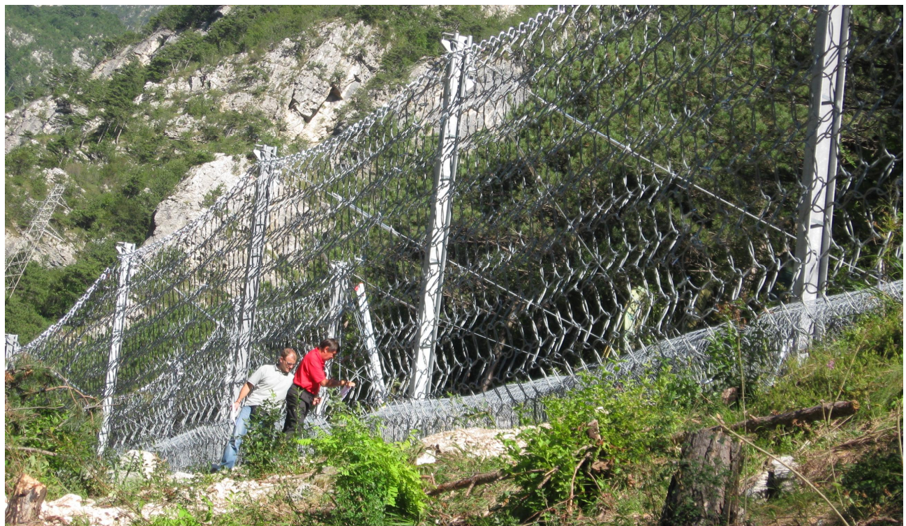
Vista della barriera in opera