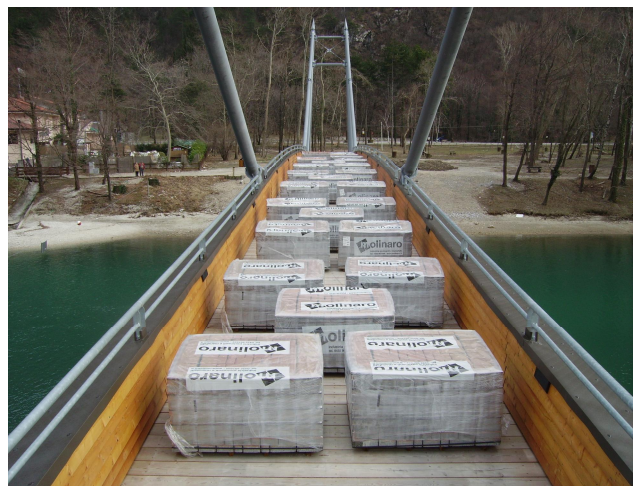
Prova di carico dell'impalcato