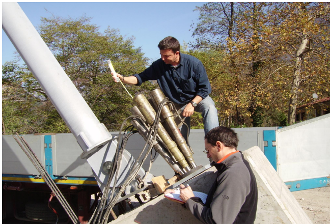
Prova di carico dei tiranti delle spalle