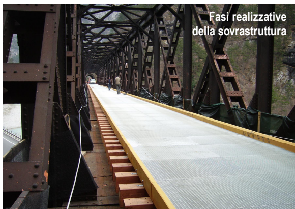
Fasi realizzative della sovrastruttura