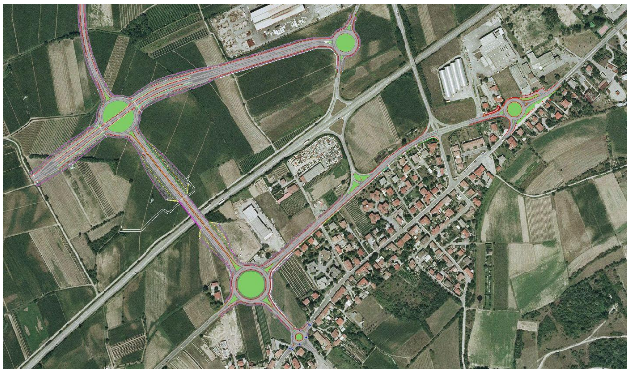
Inserimento Progetto Su Ortofoto carta