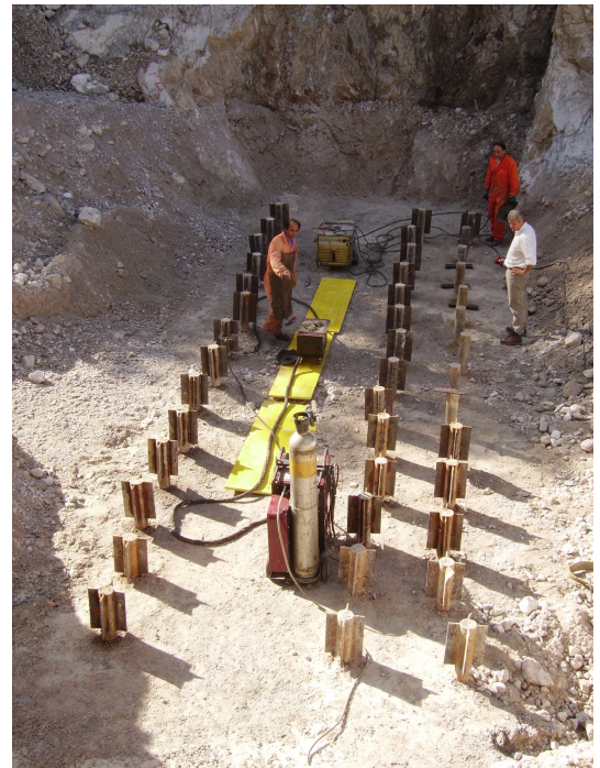
Teste micropali di fondazione