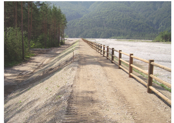
Sovralzo con ricostruzione corpo arginale