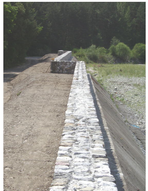
Sovralzo con muretto in c.a. e