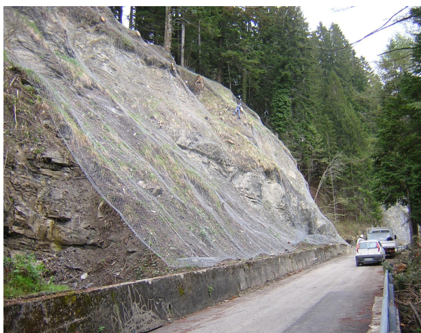
rivestimento di versante in rete metallica