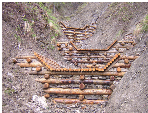
briglie di stabilizzazione in legname e pietra