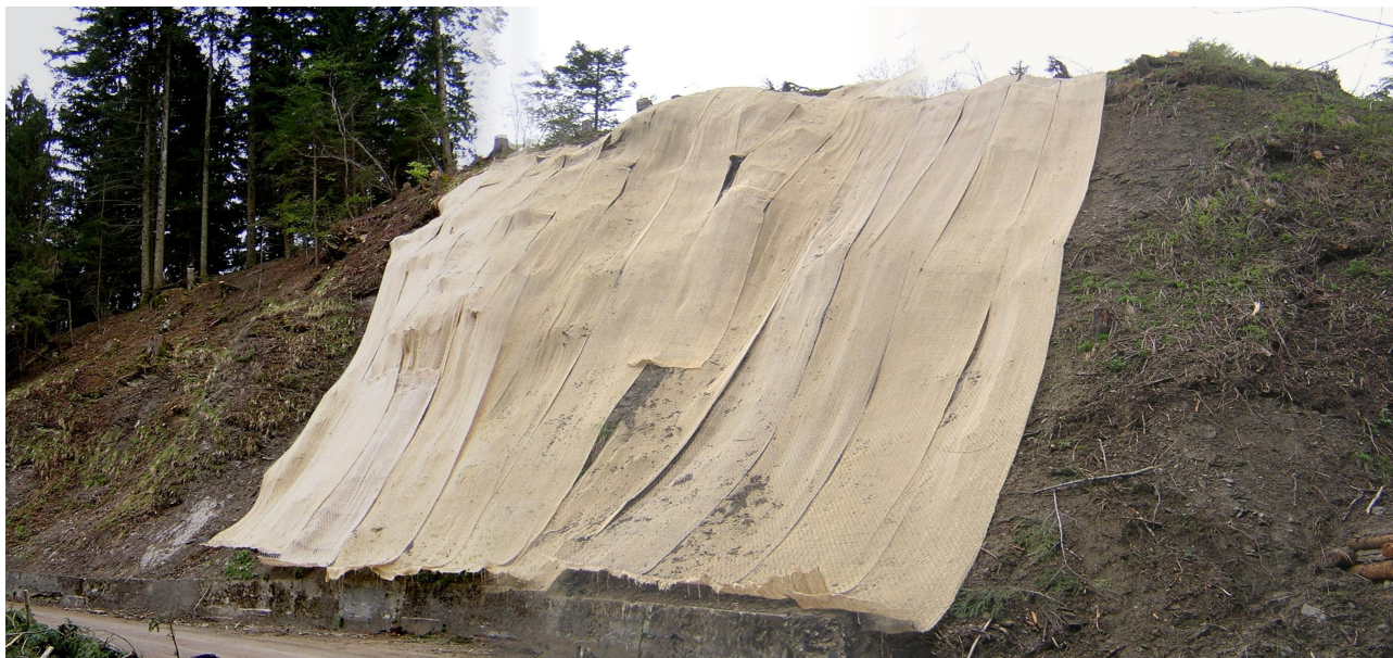
esecuzione di rivestimento di versante in rete metallica integrata con biostuoia

impresa costruttrice: Cimenti Vittorugo & C. S.a.s. – Ovaro (UD)