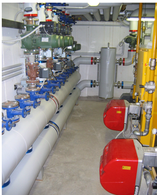
La centrale termica con le sette linee di mandata lato riscaldamento e una lato sanitario (accumuli da 2000 litri) a valle del sistema di trattamento acqua

impresa costruttrice: Cofathec Servizi sede di Udine - via Galileo Galilei n.42 - 33010 Feletto Umberto di Tavagnacco (UD)