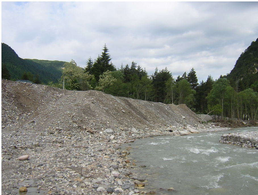
stato di fatto

impresa costruttrice: I.CO.P. S.p.A. – Basiliano (UD)