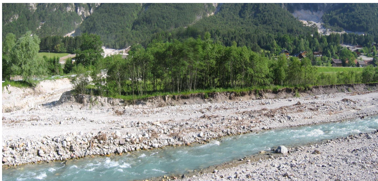
stato di fatto

impresa costruttrice: I.CO.P. S.p.A. – Basiliano (UD)