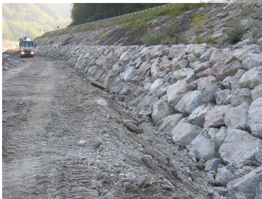
intervento di sottofondazione