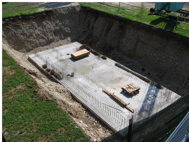
Platea di fondazione