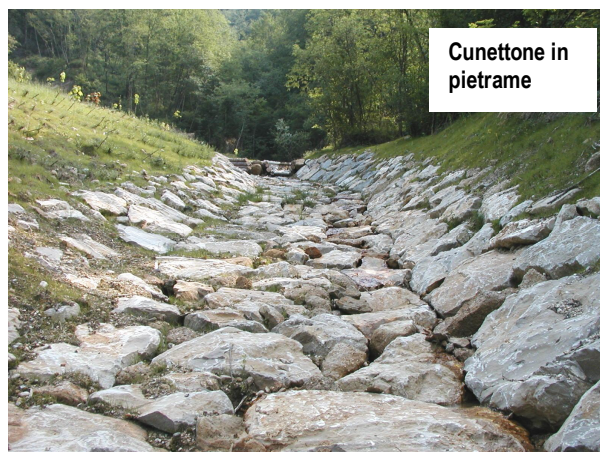
Cunettone in pietrame