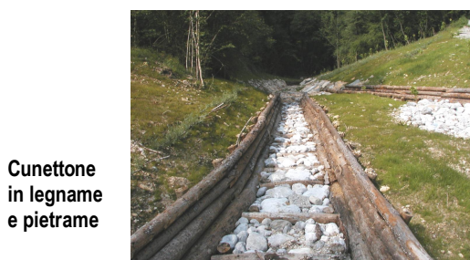
Cunettone in legname e pietrame