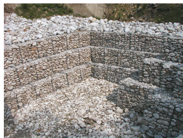
Bacino di accumulo a tergo della briglia