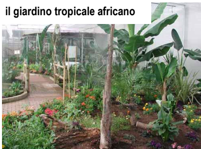
il giardino tropicale africano