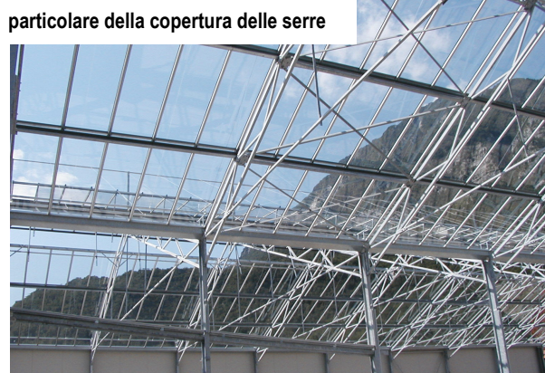
particolare della copertura delle serre

gli spazi per l'ambientazione interna e il percorso che unisce le tre serre (ambiente amazzonico, africano, asiatico)