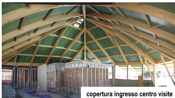
copertura ingresso centro visite

impresa costruttrice: Impresa BIDOLI GIANPAOLO, frazione Mieli 23/C 33023 Comeglians (UD)