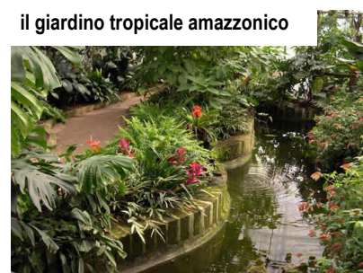
il giardino tropicale amazzonico