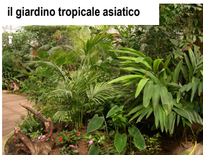
il giardino tropicale asiatico